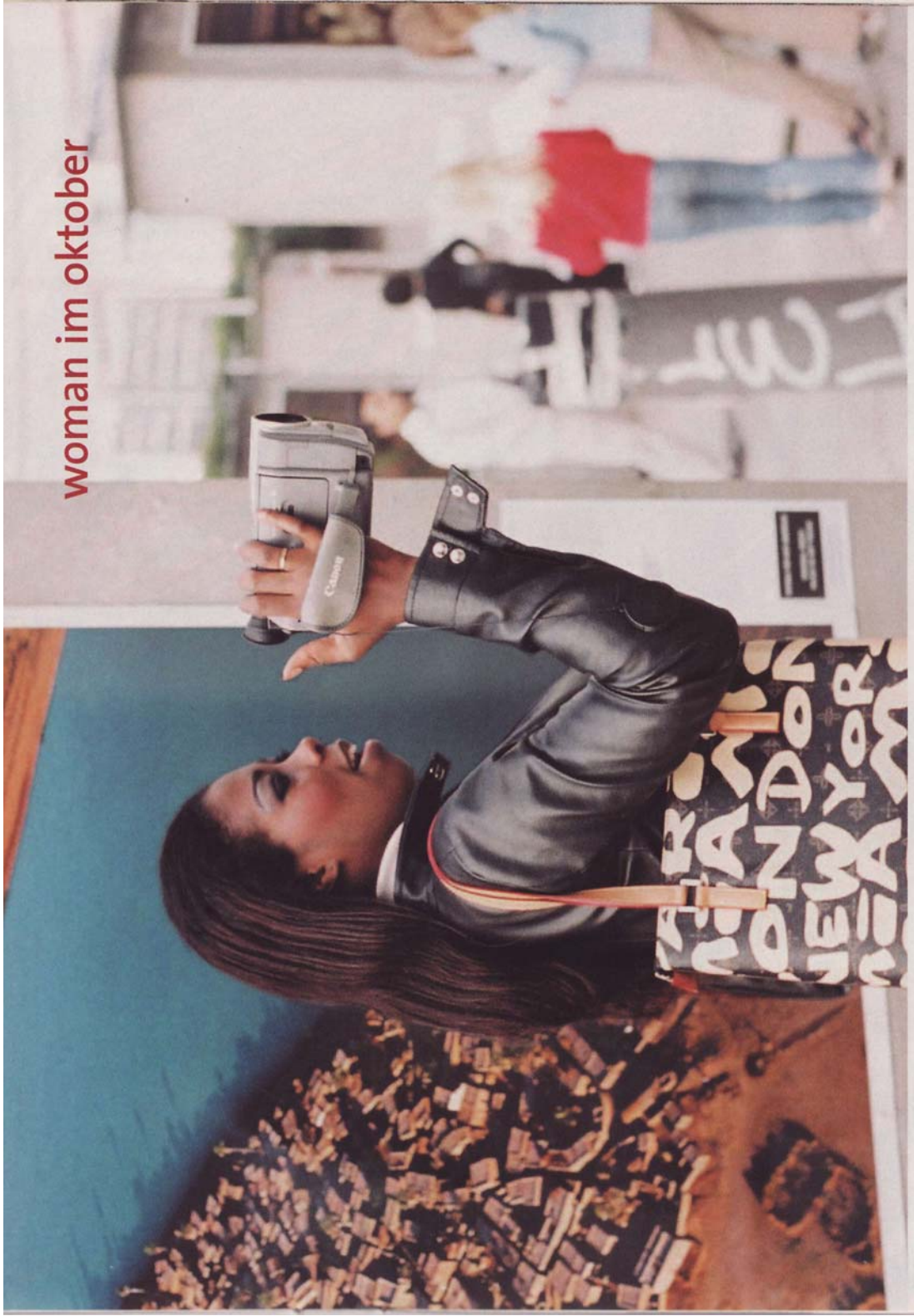
woman im oktober